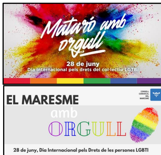
Figura 3: Exemple d'accions realitzades pels ajuntaments de la comarca i el Consell Comarcal per commemorar les diades significatives del col·lectiu LGTBI