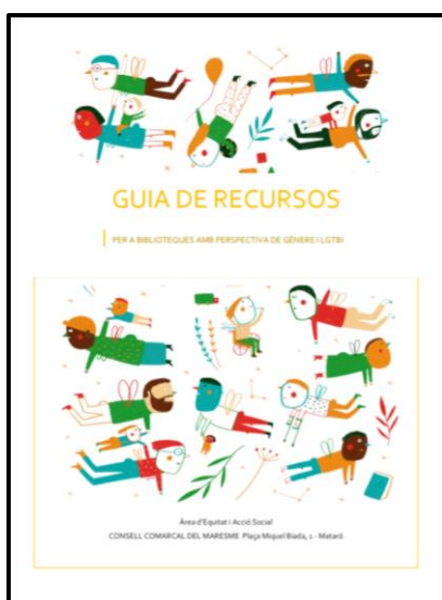
Figura 5: Imatge de la Guia de recursos per a biblioteques amb perspectiva de gènere i LGTBI