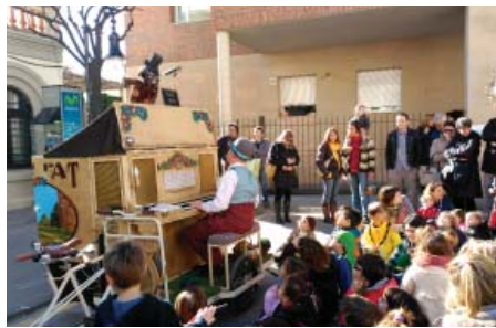
Dissabte al matí, el protagonisme va ser per als nens, que van poder gaudir del taller de gytakus, les activitats del Cau El Nus i les actuacions de La Valoneta i Bigolis Teatre.