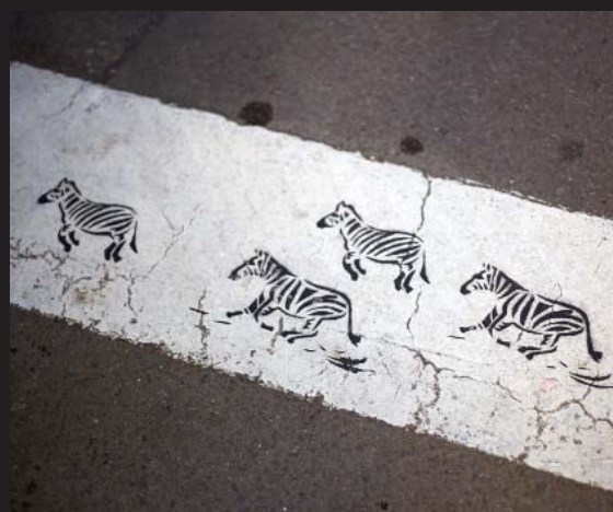
Pas de zebra a Sant Pol

Plaça de la Vila, 1 - 08395 Sant Pol de Mar 93 760 04 51 - digueslateva@santpol.cat www.santpol.cat Facebook: AjuntamentSantPol - Twitter: @ajsantpol