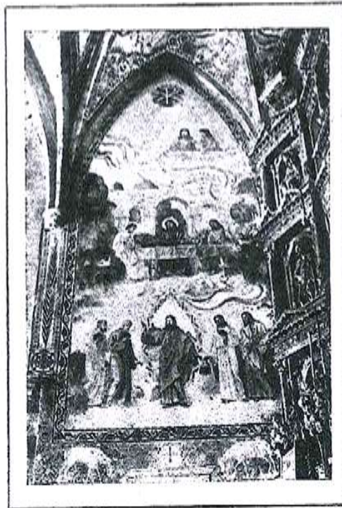
DECORACIÓ AL FRESC: PER DÀRIUS VILÀS